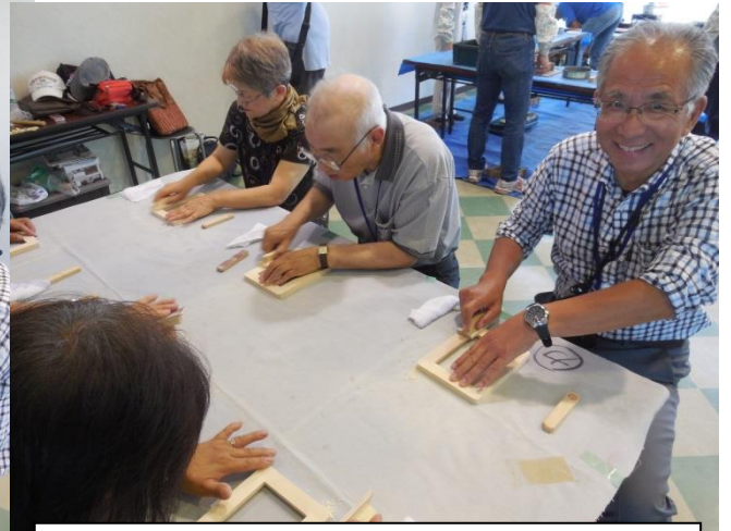
2班／余裕(?) 真剣(?) なヤスリ掛け作業