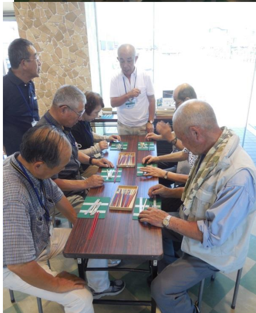
3班／My箸・金箔貼り説明風景