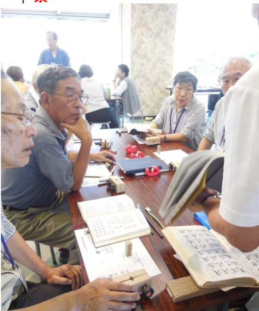
4班／落款彫刻の書体の説明を受ける