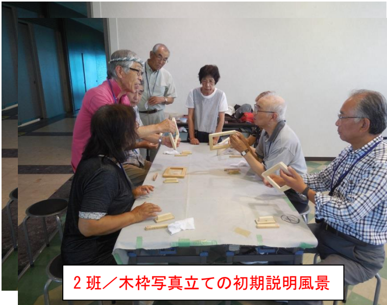
2班／木枠写真立ての初期説明風景