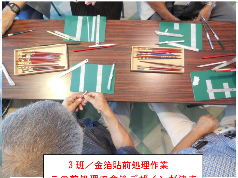
3班／金箔貼前処理作業 この前処理で金箔デザインが決まる