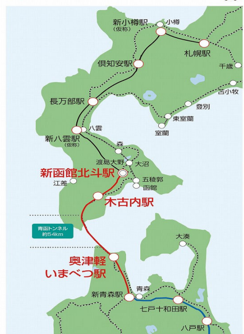
北海道新幹線の路線図

つながる！ひろがる！北海道新幹線 北海道新幹線建設局 NAVI https://hokkaido-shinkansen-navi.jp