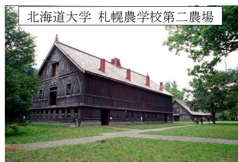
北海道大学 札幌農学校第二農場

公民館集合 (8:15) → 琴似屯田兵屋 (北海道遺産) → 北海道大学、札幌農学校第二農場 (北海道遺産)、古河講堂、旧昆虫学及養蚕学教室、クラーク像など → 昼食 → 清華亭 (北海道遺産) → 旧永山武四郎邸 → 苗穂地区工場群 (北海道遺産) を車中見学 → 公民館帰着 (16:30)